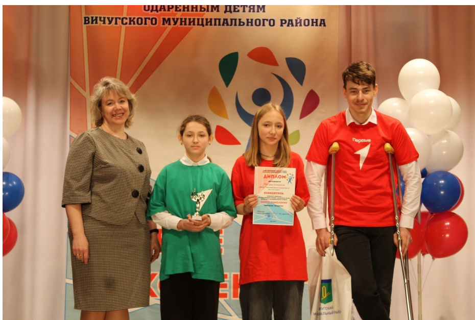
Награждение медиацентра Чертовищенской основной школы им. А.Д. Гусева

Администрация Дома детского творчества благодарит коллектив Вичугского районного Дома культуры за помощь в проведении мероприятия.