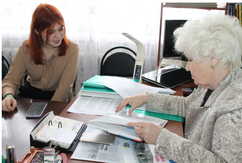
«С главным, о главном»

– Делаем выпуски от среды до среды. Материалы готовятся заранее, ино-